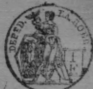
TABLE ALPHABÉTIQUE des Actes de mariages de la mairie de Süchteln pour l'an 1809 dressée en exécution du décret impérial du 20 juillet 1807.