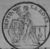
TABLE ALPHABÉTIQUE des Actes de mariages de la mairie de pour l'an dressée en exécution du décret impérial du 20 juillet 1807.