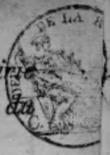
TABLE ALPHABÉTIQUE des Actes de décès de la mairie de Suhl pour l'an 1809 dressée en exécution du décret impérial du 20 juillet 1807.