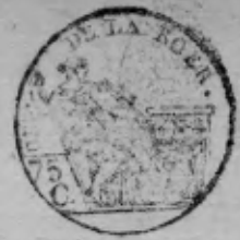
TABLE ALPHABÉTIQUE des Actes des décès de la mairie de Sachseln pour l'an 1810 dressée en exécution du décret impérial du 20 juillet 1807.