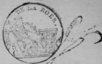
TABLE ALPHABÉTIQUE des Actes des décès de la mairie de Sucteln pour l'an 1811 dressée en exécution du décret impérial du 20 juillet 1807.