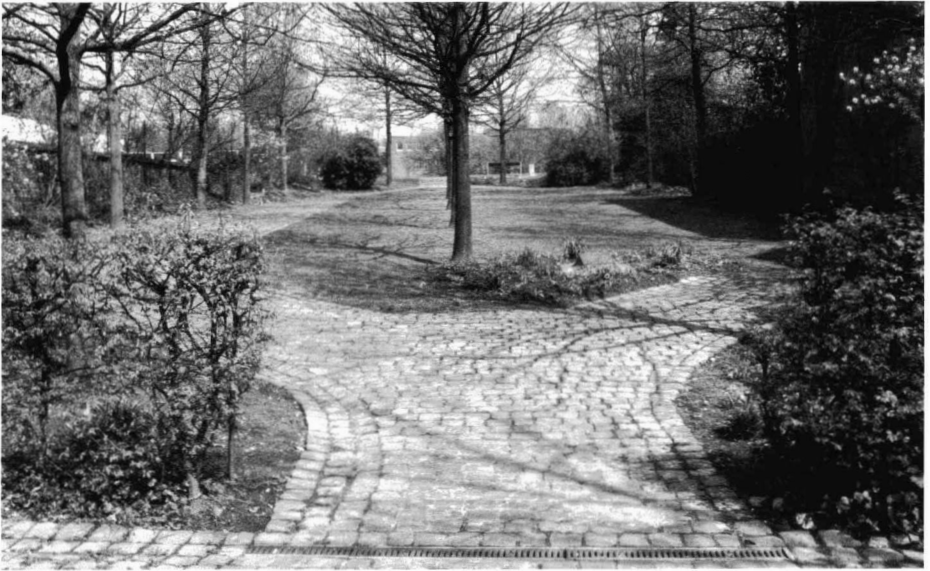
Viersen-Dülken, Venloer Straße