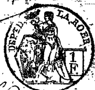
TABLE ALPHABÉTIQUE des Actes de mariages de la mairie de Kadenkirch pour l'an / 1809 adressée en exécution du décret impérial du 20 juillet 1807.