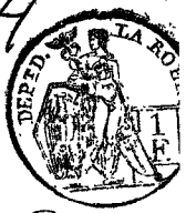
TABLE ALPHABÉTIQUE des Actes des mariages de la mairie de Valenciennes pour l'an 1811. dressée en exécution du décret impérial du 20 juillet 1807.

par-devant nous, officier de gé de ans, et attendu que les affichés; qu'aucune après avoir donné naissance des par- tri et pour femme; que unis par le mariage. agé ession d ou ession d ou ession d ou près qu'il leur en a