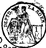
TABLE ALPHABÉTIQUE des Actes des mariages de la mairie de Kirchheim pour l'an 1812 dressée en exécution du décret impérial du 20 juillet 1807.