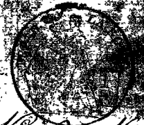
TABLE ALPHABÉTIQUE des Actes des mariages de la mairie d. Walden-Rischen pour l'an 1870. dressée en exécution du décret impérial du 20 juillet 1807.