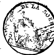
TABLE ALPHABÉTIQUE des Actes de naissances de la mairie de Lobberich pour l'an 1812 dressé en exécution du décret impérial du 20 juillet 1807.

vingt trois De matin area, Moavin il est com- trent quatre et a Lobberich et Du fca rois de Douw à windbergs - épouse et a Lob sise rue es prénoms Declaration des fixés dans, profes Lobberich ranti quatre comurant es signi et leur