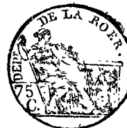
TABLE ALPHABETIQUE des Actes des naissances de la mairie des Eschevins pour l'an 1811 dressée en exécution du décret impérial du 20 juillet 1807.