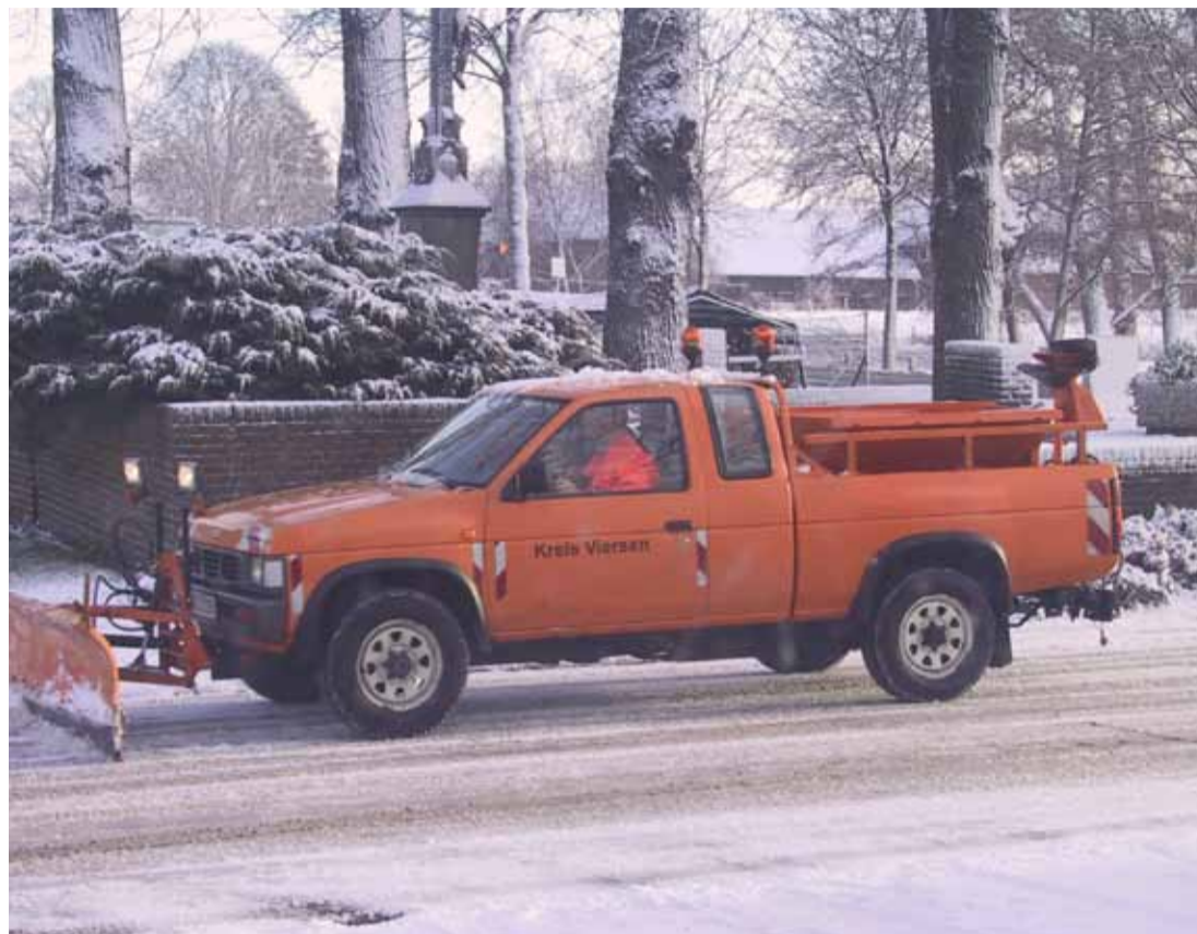
Der Eis-Spion mit seinem Fahrzeug im Einsatz: Bei Glätte, Schnee und Eis ist er morgens der erste auf den Straßen im Kreis Viersen.